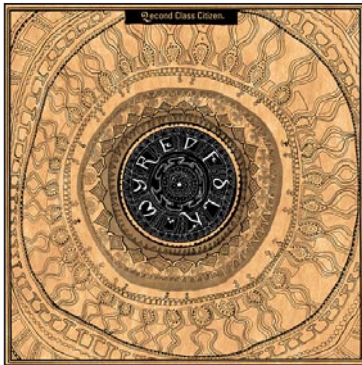
12" picture sleeve with printed inlay

Artist: 2econd Class Citizen Title: Wyrd Folk EP Label: Equinox Records Cat.Nr.: eqx-009 Format: 12" Release Date: February 26, 2007 Distribution via: Hausmusik www.hausmusik.com