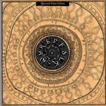
12" picture sleeve with printed inlay

Artist: 2econd Class Citizen Title: Wyrd Folk EP Label: Equinox Records Cat.Nr.: eqx-009 Format: 12" Release Date: February 26, 2007 Distribution via: Hausmusik www.hausmusik.com